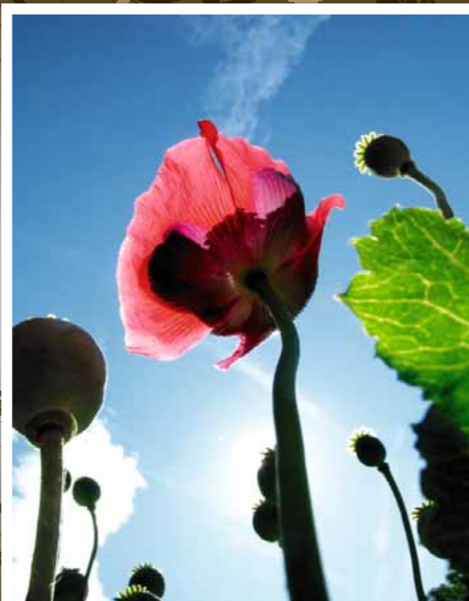
1. Platz: Anja Golka

Die Gewinner unseres großen Fotowettbewerbes stehen fest