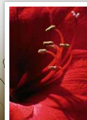
3. Platz: Klaus Wäscher